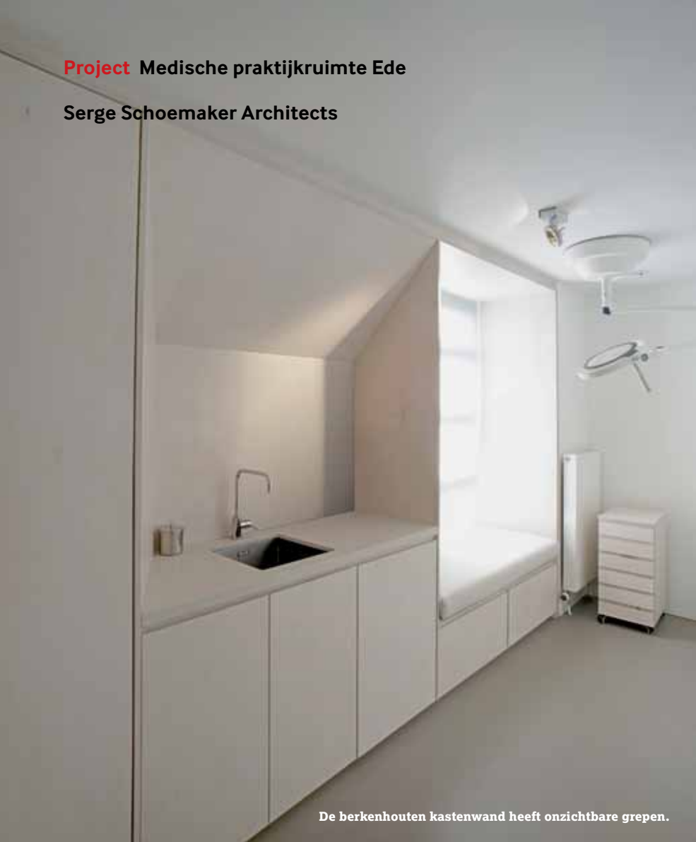
De berkenhouten kastenwand heeft onzichtbare grepen.

In de oude praktijkruimte gaven de aanwezige tafels, stoelen, archieflades, voorraadkasten en medische apparaten een rommelige en volle aanblik. Serge Schoemaker Architects koos ervoor om het aantal objecten in de ruimte te verminderen door één groot meubel te maken dat verschillende functies met elkaar combineert. Het werd een monolithische, wandvullende kastenwand met onzichtbare grepen. De op maat gemaakte kast beslaat de hele lengtezijde van de ruimte en vormt de natuurlijke invulling van de ruimte tussen twee kolommen. De multifunctionaliteit en de compactheid van het ontwerp zorgen voor een flinke ruimtebesparing. De kastenwand kan gebruikt worden om op te zitten, om patiëntendossiers en medische literatuur op te bergen en om medische apparatuur in te bewaren. Ook is er een kitchenette in geïntegreerd.