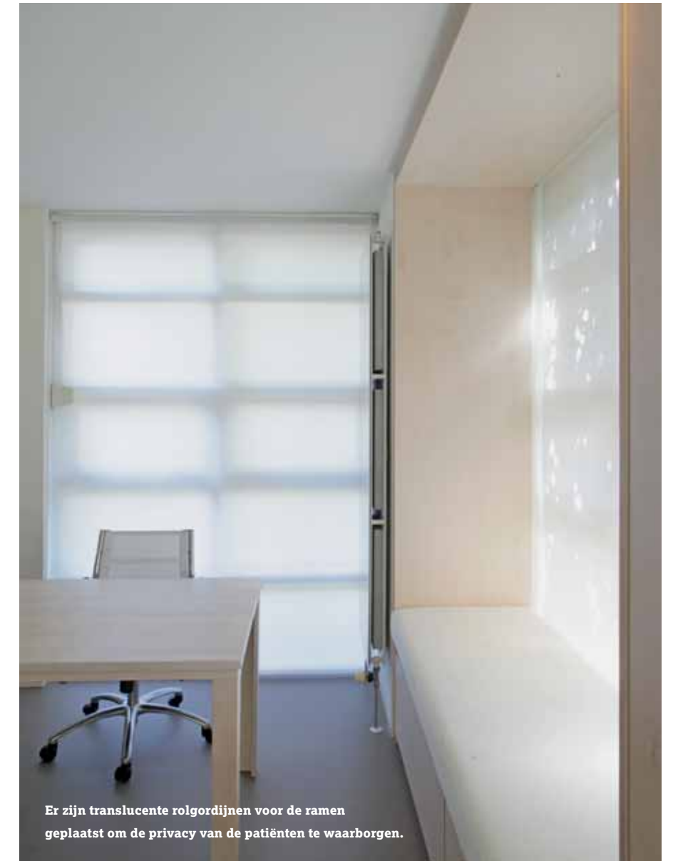
Er zijn translucente rolgordijnen voor de ramen geplaatst om de privacy van de patiënten te waarborgen.

krijgt. Een ander effect van de schuine afwerking is, dat het licht onder verschillende hoeken langs de nieuw gecreëerde zitplaatsen de kamer binnenstroomt. Het transparant gelakte beukenmultiplex met witte onderlaag van het meubel komt ook terug in de ladeblokken en in het bureau. Dit werkt rustgevend en versterkt de serene uitstraling. De witte muren en een nieuwe leemkleurige gietvloer versterken de een lichte en 'cleane' sfeer. Om de privacy van de patiënten te waarborgen, zijn er translucente rolgordijnen voor de ramen geplaatst. Zo kan de lichtinval en het zicht naar binnen goed gereguleerd worden en aangepast worden aan de omstandigheden. De ruimte wordt namelijk niet alleen als spreekkamer gebruikt, maar fungeert ook als vergaderruimte. Een geslaagde metamorfose en tevreden gebruikers. De strakke ontwerpstyl van Serge Schoemaker Architects blijkt uitstekend geschikt voor medische ruimtes.