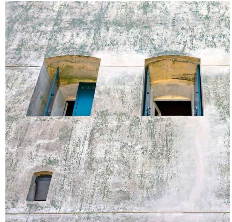
Het fort stamt uit het begin van de vorige eeuw.