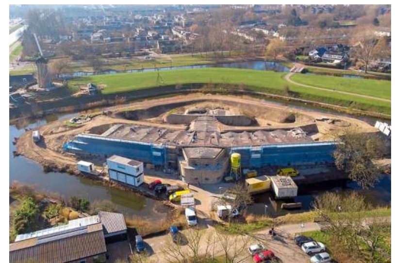
Het forteiland. Linksboven molen De Eersteling.