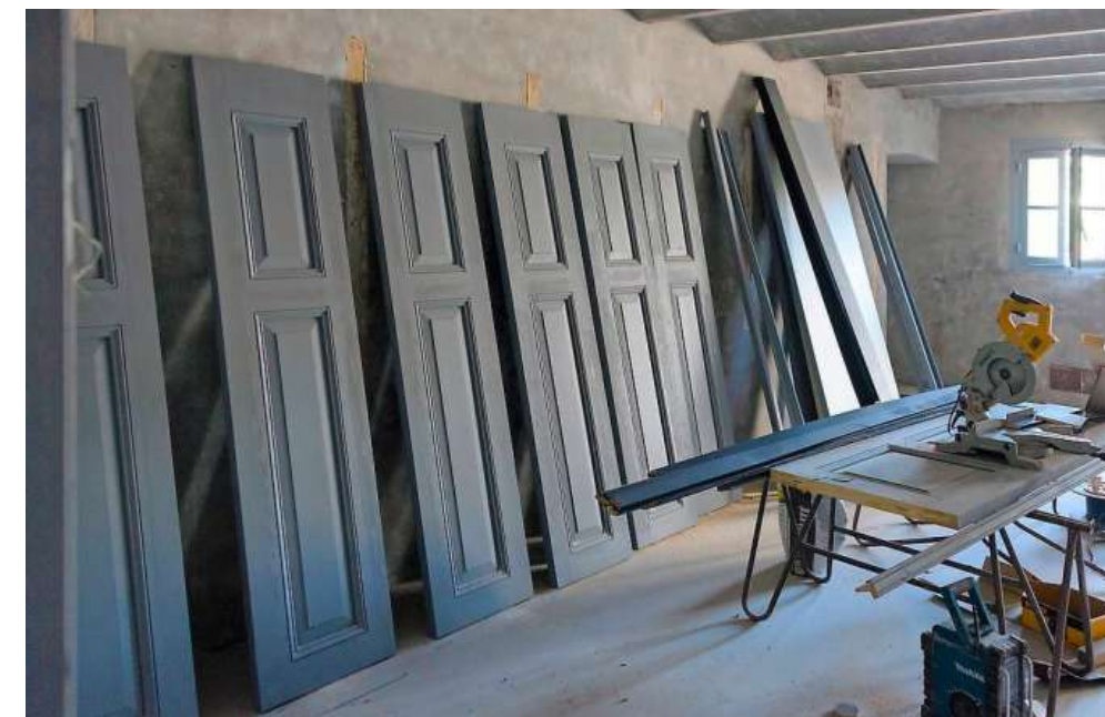
Bijna honderd oude deuren werden opgeknapt.