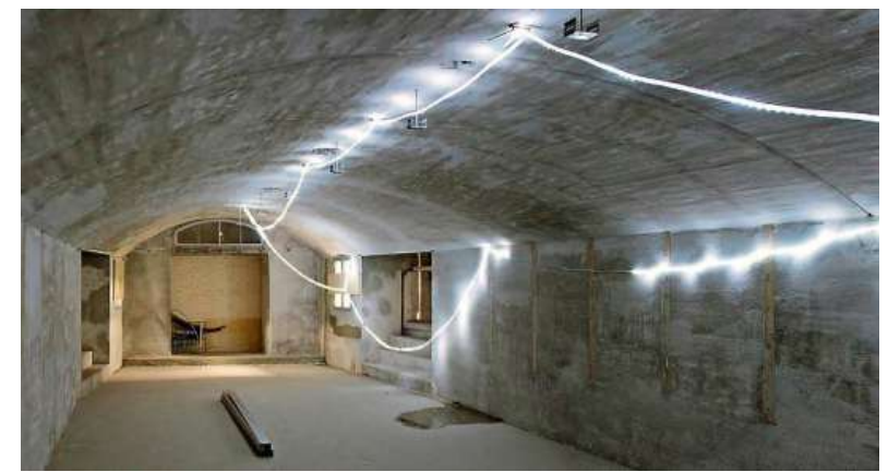
Deze zaal is straks af te huren.