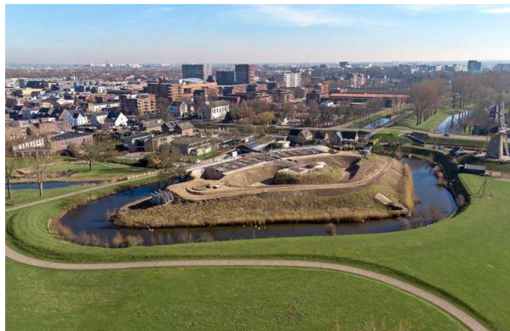
Het fort kwam bloot te liggen tijdens de werkzaamheden.