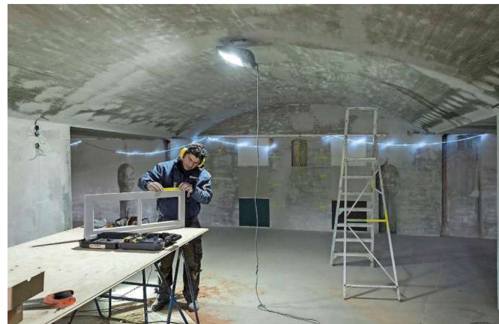
In het fort wordt momenteel hard gewerkt.